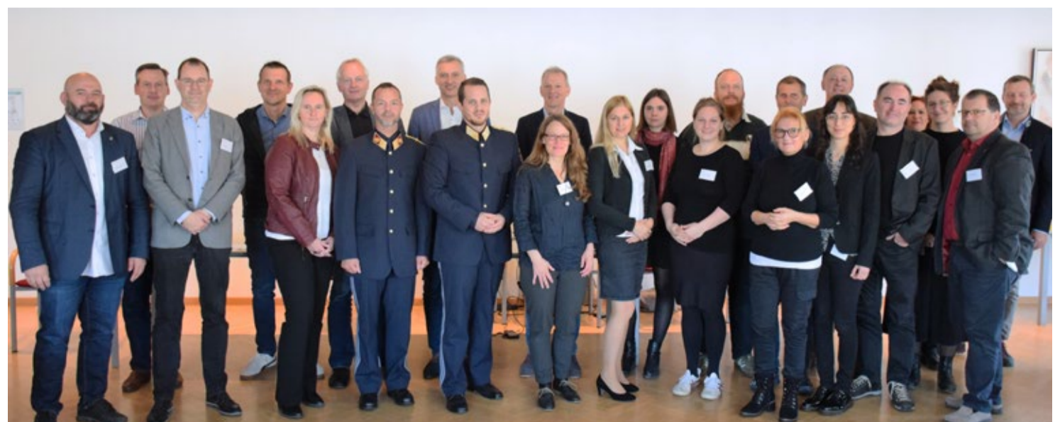
Vertreter*innen der Partnerorganisationen beim Projektstart von ESBH im Bundesministerium für Justiz